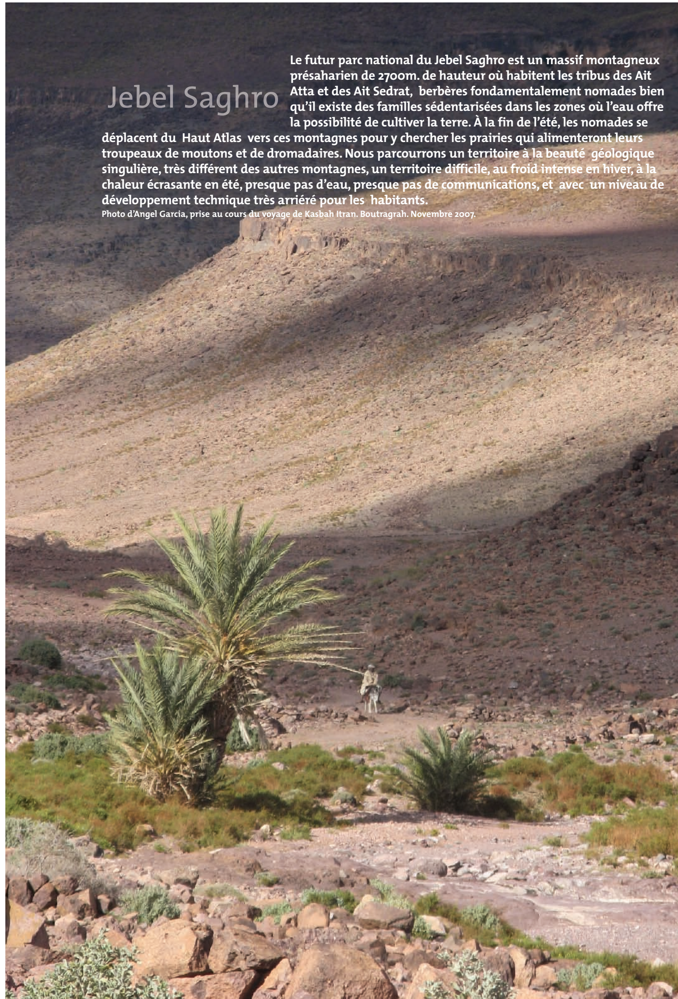
prise au cours du voyage de Kasbah Itran. Boutragrah. Novembre 2007.

déplacent du Haut Atlas vers ces montagnes pour y chercher les prairies qui alimenteront leurs troupeaux de moutons et de dromadaires. Nous parcourons un territoire à la beauté géologique singulière, très différent des autres montagnes, un territoire difficile, au froid intense en hiver, à la chaleur écrasante en été, presque pas d'eau, presque pas de communications, et avec un niveau de développement technique très arriéré pour les habitants.